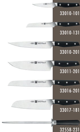
33042-000 Messerblock, 8-tlg. Knife block, 8 pcs. Bloc de couteaux, 8 pcs.