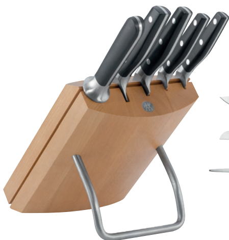
33041-000 Messerblock, 6-tlg. Knife block, 6 pcs. Bloc de couteaux, 6 pcs.