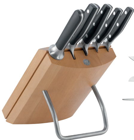
33041-000 Bloque cuchillos, 6 pzs. Ceppo di coltelli, 6 pz Messenblok, 6-dlg.