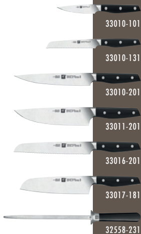
33042-000 Bloque cuchillos, 8 pzs. Ceppo di coltelli, 8 pz Messenblok, 8-dlg.