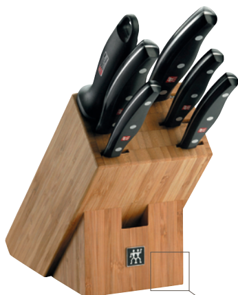
30756-200 Bloque cuchillos, 7 pzs. Ceppo di coltelli, 7 pz Messenblok, 7-dlg.