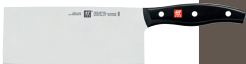
Cuchillo cocinero chino · Coltello da cuoco cinese · Chinees koksmes 30795-180