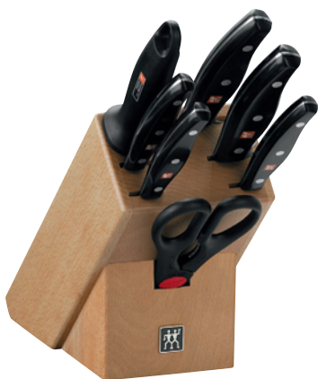
30761-000 Bloque cuchillos, 8 pzs. Ceppo di coltelli, 8 pz Messenblok, 8-dlg.